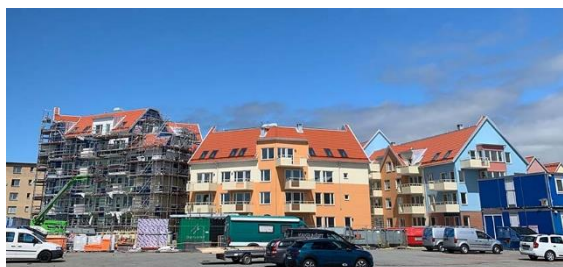
Kvarter India juni 2021.

I hus A pågår parketläggning på plan 6 och på plan 5 monteras kök. Plattsättning på plan 5-6 sker också. I hus B och C pågår nu