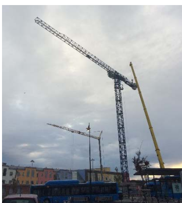
Kranen kvarter Signalflyget 1 monterad

Avseende produktionen i Signalflyget 1 (kvarter N) är källarytterväggarna nu färdiggjutna och den stora kranen är monterad och i drift.